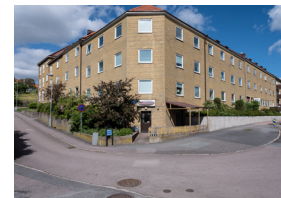
Lilla Karlagatan 40 2 rum, 50 kvm

Vår målsättning med varje uthyrning är "rätt kund till rätt lokal" för ett långsiktigt eller kortsiktigt hyresförhållande. Vi arbetar för en bra relation där du skall kunna vara med och påverka som lokalhyresgäst. Kvalité, ordning och reda är viktigt för oss. Vi har olika typer av lokaler. Exempelvis förskolor, kontor och förråd. Vi har inga restauranger, matbutiker eller musikstudios.