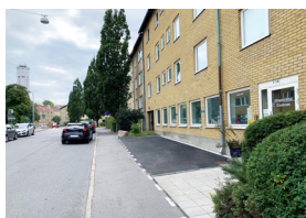
St. Pauligatan 21 5 rum, 150 kvm