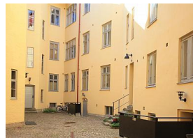
Drottninggatan 73 B 2 rum, 54 kvm