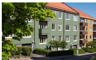
Lundgatan 9 1 rum, 50 kvm